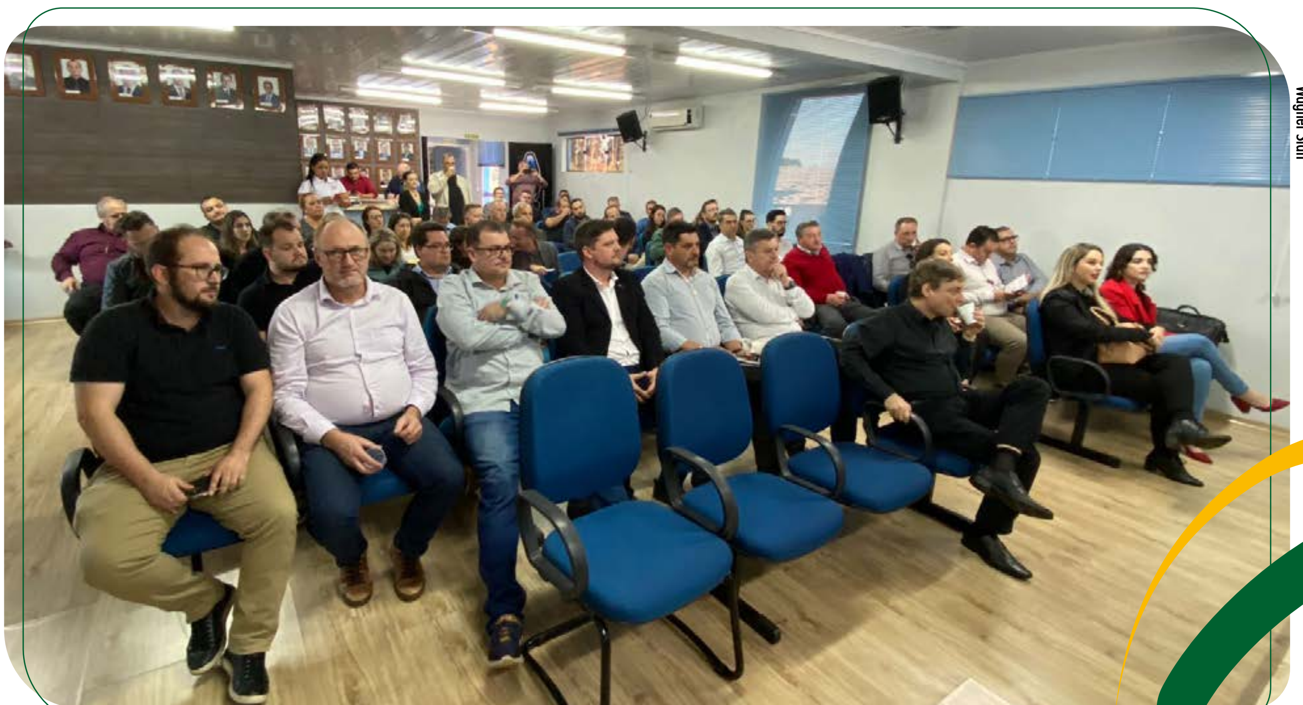
Prefeitos dos 43 municípios da Amzop participam de debate sobre Piso do Magistério