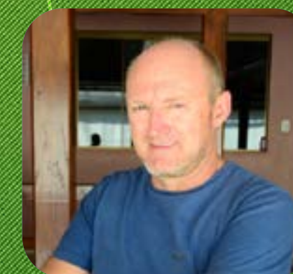
Pinheirinho do Vale Nelbo Appel