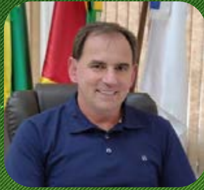
Cerro Grande Álvaro de Carli