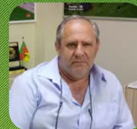
Pontão Velton Vicente Hahn